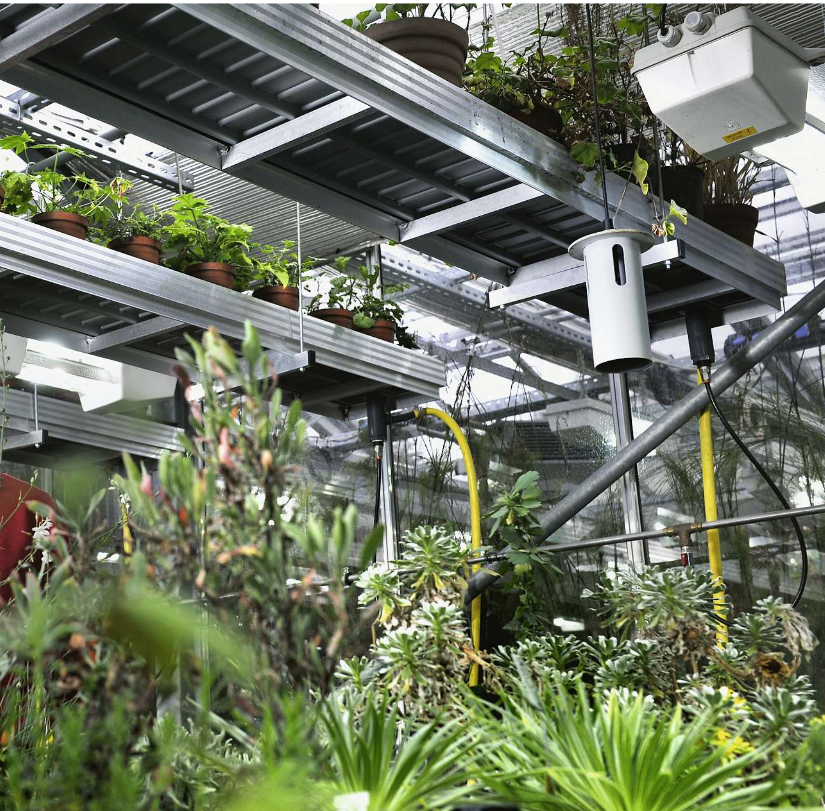
spiel von Bienen und Orchideen, um herauszufinden, wie Arten entstehen.