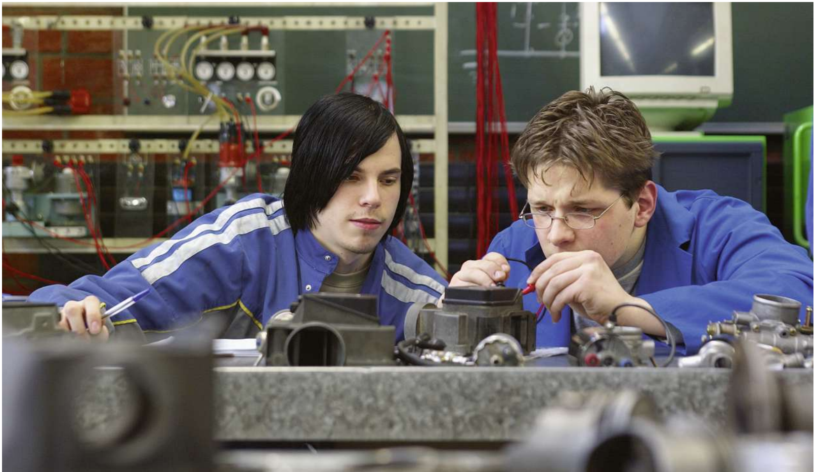
Der Weg zu einem guten Lohn: eine solide Lehre kombiniert mit der passenden Weiterbildung.