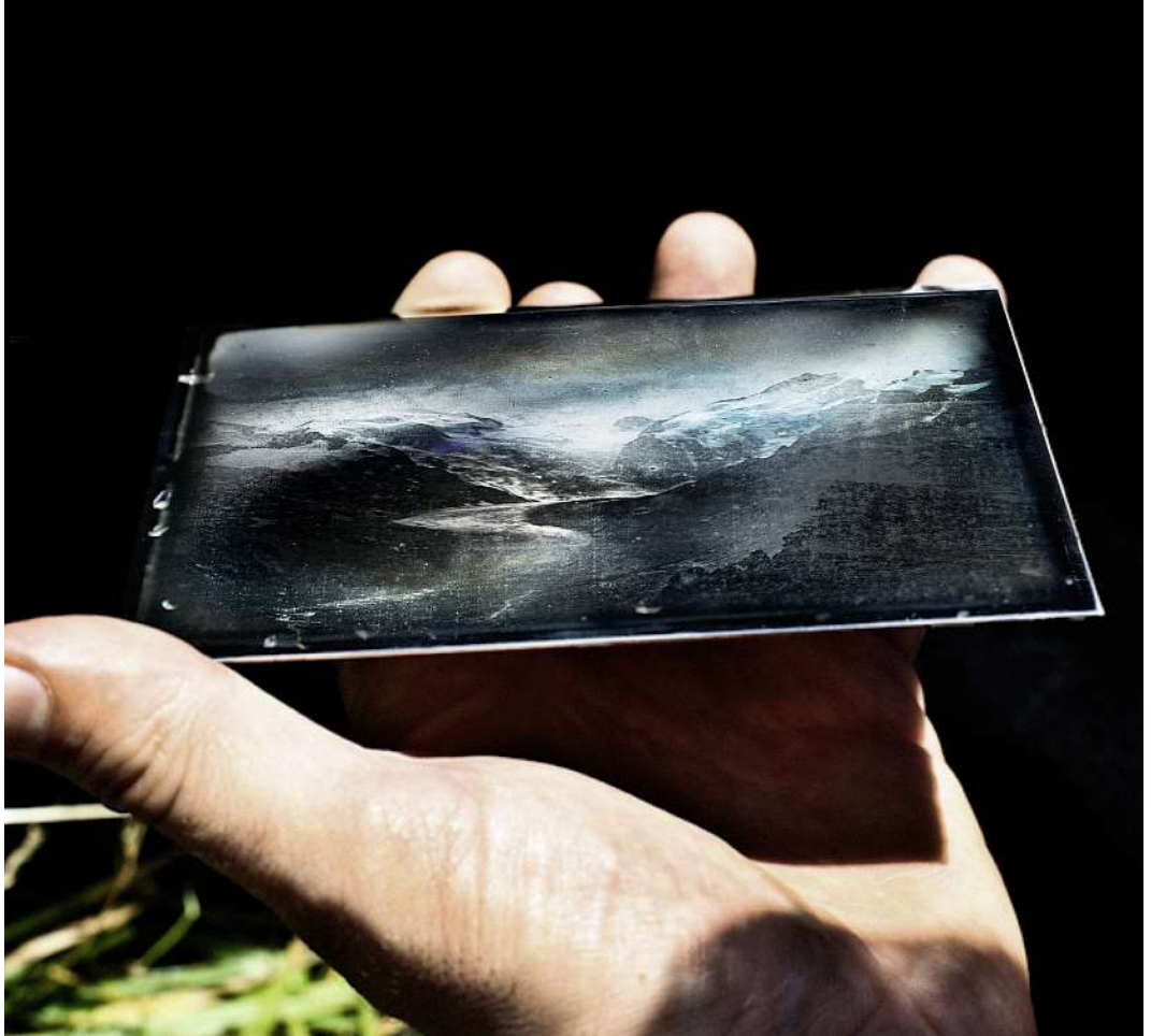
Urtümliche Sofortbildtechnik: Knapp zehn Minuten braucht es, bis die Daguerreotypie im Freiluftlabor entwickelt ist.

ferplatte mit Jod und Brom lichtempfindlich gemacht. Dann wird das Bild in der Kamera belichtet. Dabei wird das entstandene Silberjodid und -bromid an den belichteten Stellen zu metallischem Silber reduziert. Danach wird die belichtete Platte im Quecksilberdampf entwickelt, wobei sich Silber und Quecksilber zu einem äusserst haltbaren Amalgam verbinden. Anschliessend wird das Bild in einem Thiosulfat-Bad fixiert und in einer Goldchlorid-Lösung veredelt.