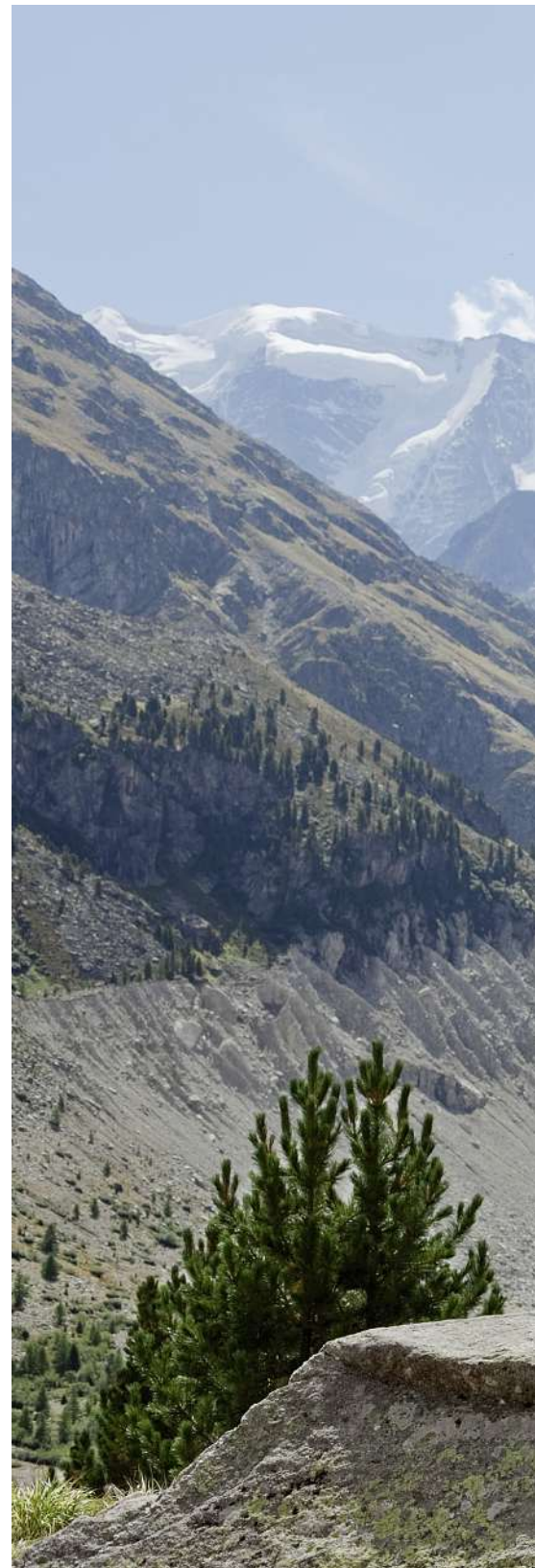
Premiere auf hochalpiner Bühne: Der Fotograf Jos Schmid und

Daguerreotypie verbindet nicht nur Technik und Kunst. Sie ist auch handfeste und zudem ziemlich giftige Chemie. Zuerst wird die versilberte Kup-