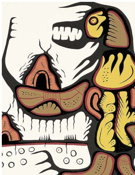
«Demolish» von Josh Kakegamic, 1977 (Ausschnitt)