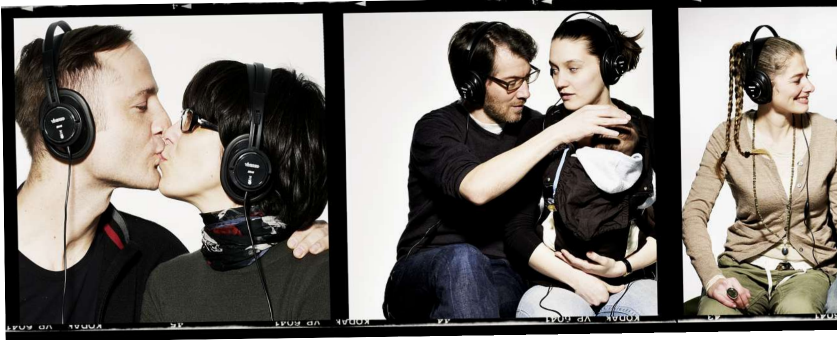
Wenn Paare sich nicht mehr richtig verstehen: Eine am Psychologischen Institut entwickelte Therapie hilft kommunikative Hürden zu überwinden und das Vertrauen zu stärken.